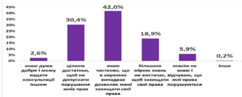
Рис. 2. Розподіл відповідей на запитання «Наскільки Ви знаєте свої права, пільги та гарантії, передбачені законодавством України?» (у відсотках)