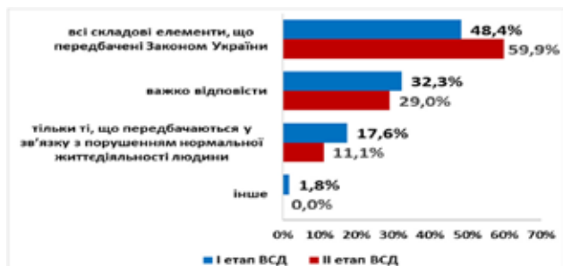
Рис. 4. Розподіл відповідей на запитання щодо змісту поняття соціальний захист військовослужбовців та членів їх сімей (у відсотках)

Близько половини респондентів (48,4% на першому етапі та 59,9% – на другому) вважають, що соціальний захист військовослужбовців та членів їх сімей, включає всі складові, передбачені Законом України “Про соціальний захист військовослужбовців та членів їх сімей”. (рисунок 4). У той самий час, лише 11,1% та 17,6% військовослужбовців, за результатами першого та другого етапів ВСД, здатні розділяти відповідні складові на види забезпечення та власне, соціальний захист. Майже третина опитаних, на обох етапах ВСД, не змогла визначитись з цього питання.