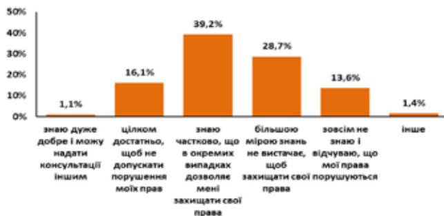
Рис. 1. Розподіл відповідей на запитання «Наскільки Ви знаєте свої права, пільги та гарантії, передбачені законодавством України?» (у відсотках)