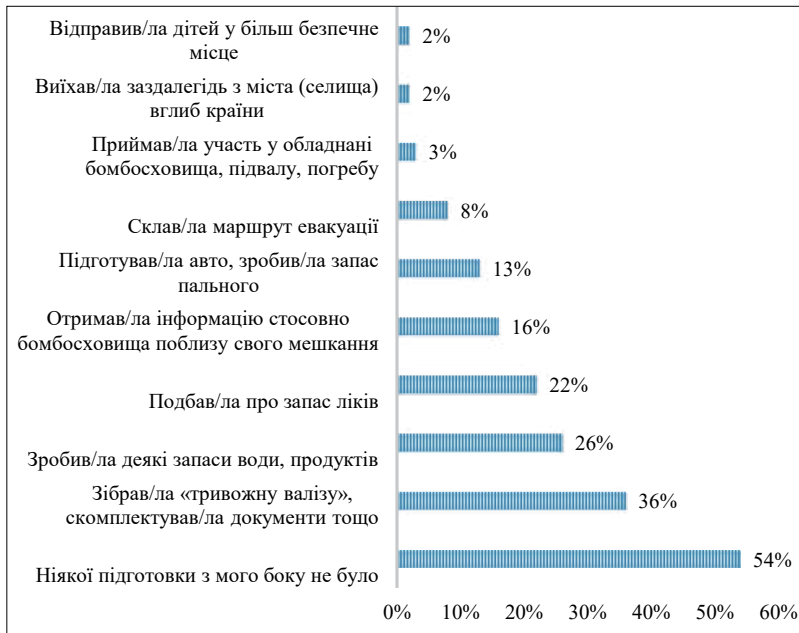
Рис. 1. Як готувалися респонденти особисто до початку воєнних подій (кількість відповідей не було обмежена)

Як засвідчили перші дні війни, ніякого плану для цивільних не існувало, і сім'ї самостійно приймали стратегічні рішення, як вижити у горнилі терористичної навали. Більшість респондентів, як демонструють результати опитування, нічого не робила в плані підготовки до війни (див. рис. 1).