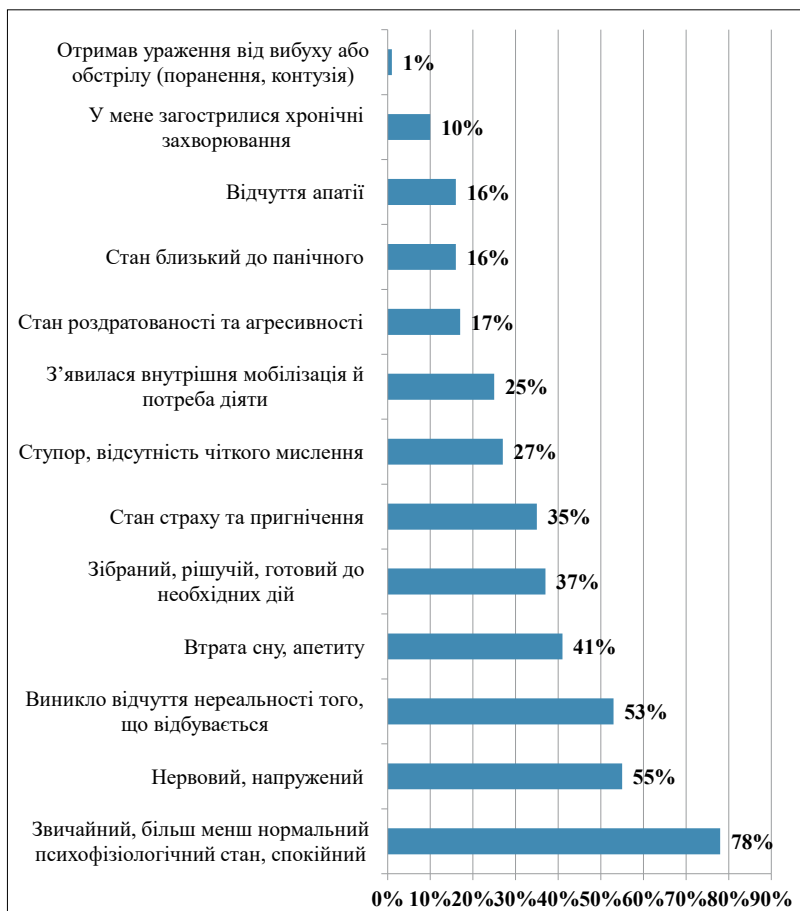
Рис. 3. Як респонденти оцінили власний психологічний стан на початку війни

частина респондентів додають такі позиції як «нервова напруга» чи «втрата сну та апетиту», а також відчуття сюрреалістичності всього, що відбувається.