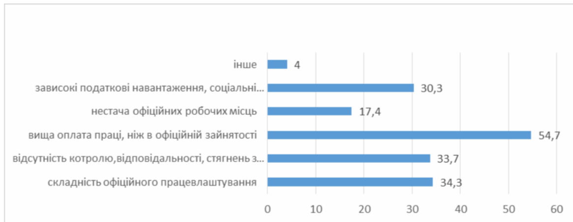
Рис. 1. Головні причини зайнятості в неформальній сфері

Серед основних учасників неформальної зайнятості переважають студенти (65,7%). Для них високим може бути ризик залишитися в цьому секторі, тобто не легалізувати свою зайнятість, зважаючи на можливість отримання значно більшої оплати праці. Високим є відсоток зайнятих також серед безробітного населення (50,9%), яке не висуває вимог щодо легалізації своєї зайнятості. Для них, можливо, важливою є наявність роботи взагалі, як стратегії виживання й адаптації до соціально-економічних умов українського суспільства (рис. 2).