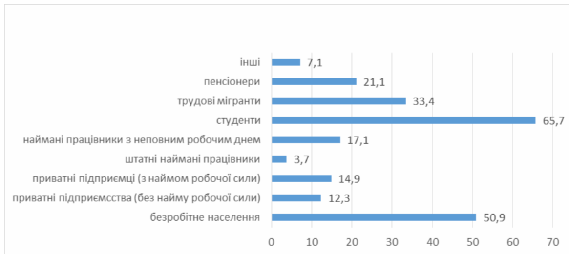
Рис. 2. Учасники неформальної зайнятості

Серед основних учасників неформальної зайнятості переважають студенти (65,7%). Для них високим може бути ризик залишитися в цьому секторі, тобто не легалізувати свою зайнятість, зважаючи на можливість отримання значно більшої оплати праці. Високим є відсоток зайнятих також серед безробітного населення (50,9%), яке не висуває вимог щодо легалізації своєї зайнятості. Для них, можливо, важливою є наявність роботи взагалі, як стратегії виживання й адаптації до соціально-економічних умов українського суспільства (рис. 2).