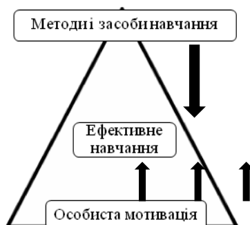
Рис. 1. Співвідношення базових факторів ефективного навчання

Коучингове консультування дає змогу побудувати схематичну модель для мотивації в освітній діяльності (рис. 1).