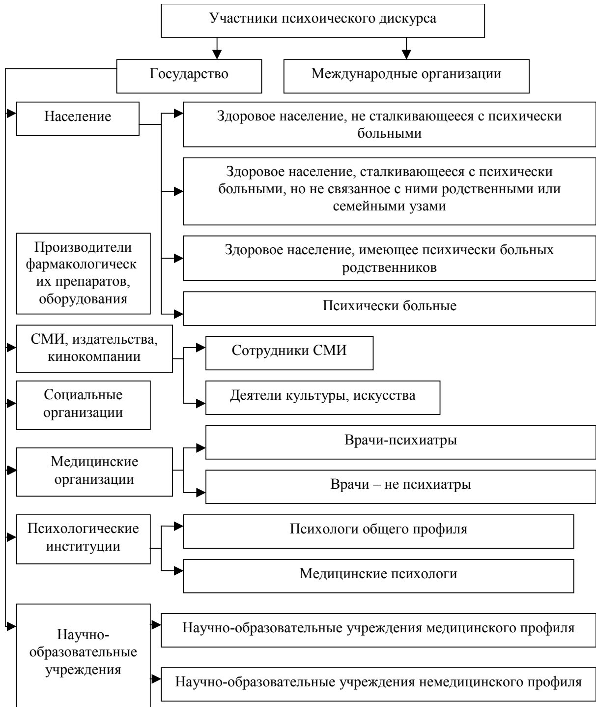
Рис. 1 Структура участников психоического дискурса