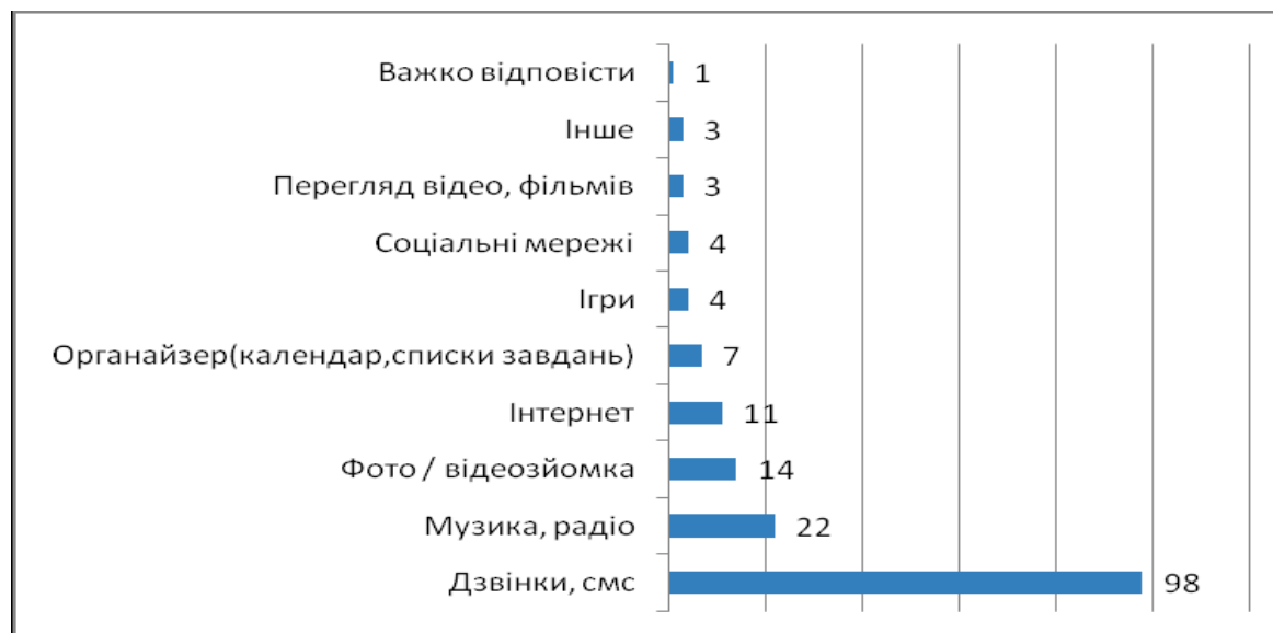
Рис. 1. Розподіл відповідей на запитання: “Яким чином Ви використовуєте мобільний телефон?”, %

Що стосується платформ, то найпоширенішою залишається Android (27%), на другому місці – IOS (13%), на третьому – Symbian (12%), що дивно, з огляду на те, настільки значний розрив за кількістю апаратів iPhone і Nokia; 7% припадає на частку Windows Phone, а 29% важко відповісти, на якій операційній системі працюють їх мобільні телефони.