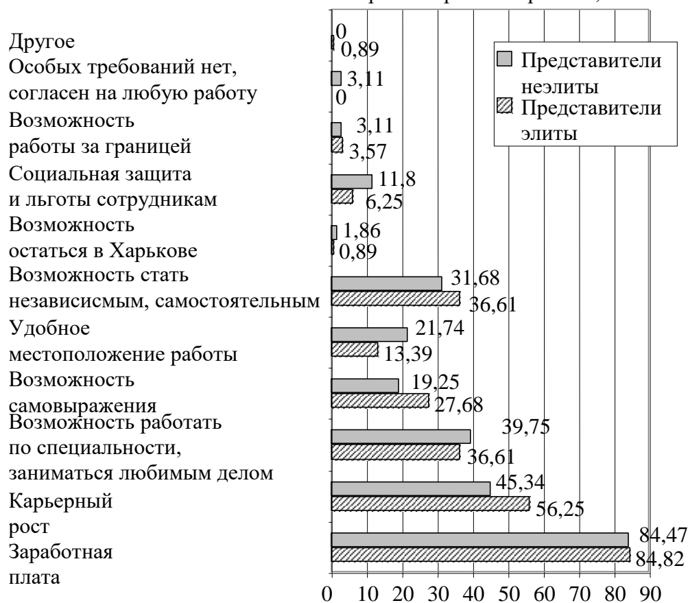
Рис. 1. Показатели выбора места работы представителями экономических специальностей